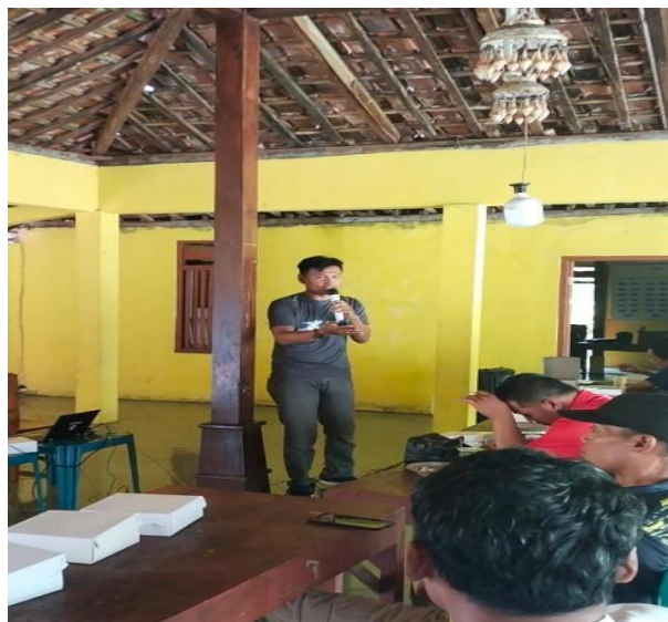
Gambar 1. Kegiatan Teori Pengabdian Masyarakat