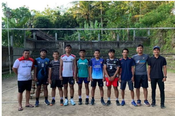
Gambar 2. Kegiatan Praktek Pengabdian Masyarakat